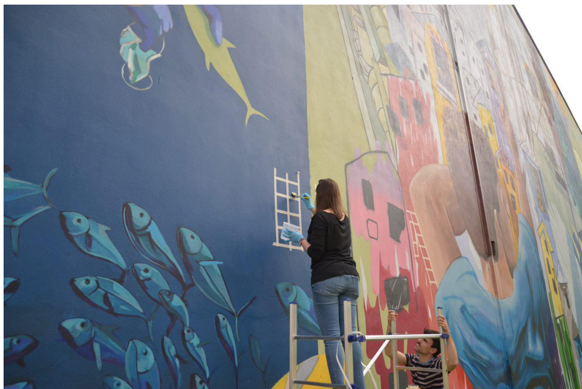
Figura 5 - Particolare del murale urbano: "Necesse" realizzato da SMOE Studio a Milano. Applicazione dei protettivi selezionati in aree campione.