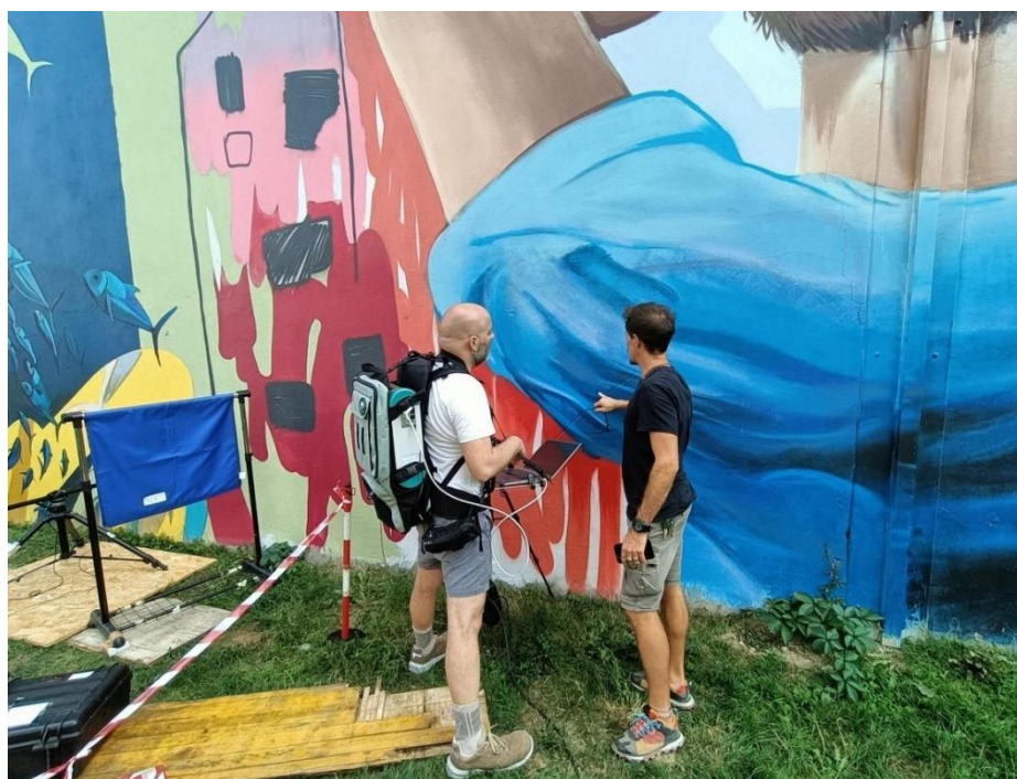
Figura 6 - Particolare del murale urbano: "Necesse" realizzato da SMOE Studio a Milano. Valutazioni dei materiali costitutivi tramite strumentazioni portatili.