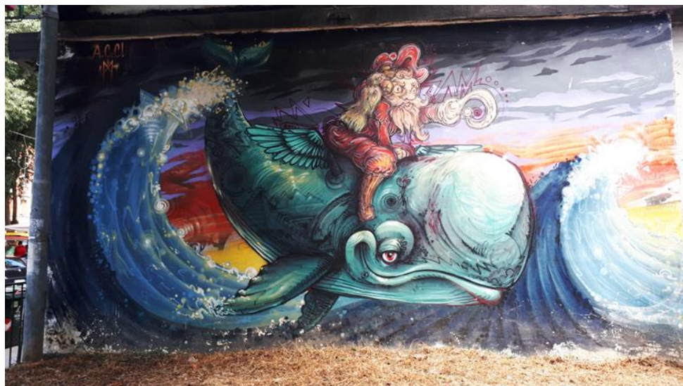
Figura 1 - Murale realizzato da Alessandro Caligaris e Mauro 149 e collocato al MAU (MUSEO DI ARTE URBANA) di Torino.