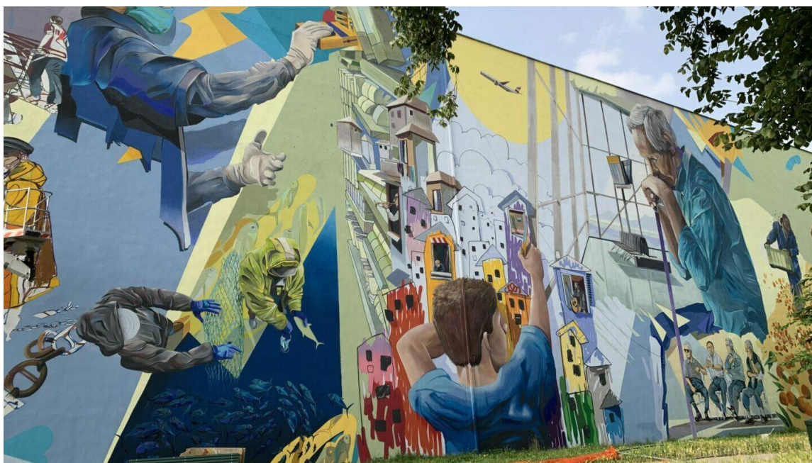
Figura 3 - Il murale urbano "Necesse" realizzato da SMOE Studio a Milano nel 2021.