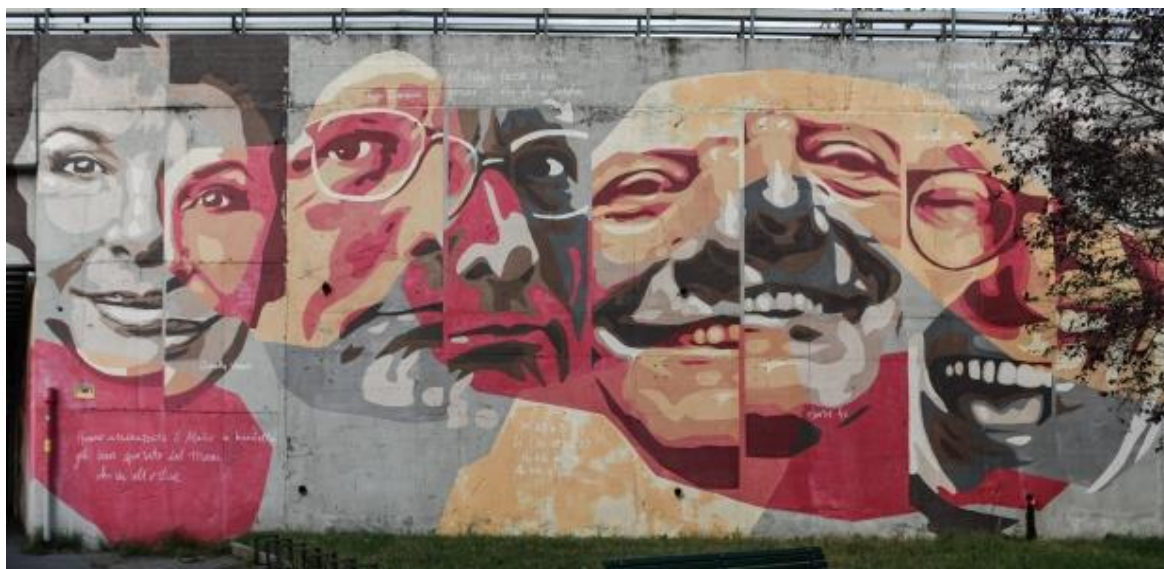
Figura 4 - Il murale urbano "MUSICA POPOLARE" realizzato da Orticanoodle nel 2016 a Milano.