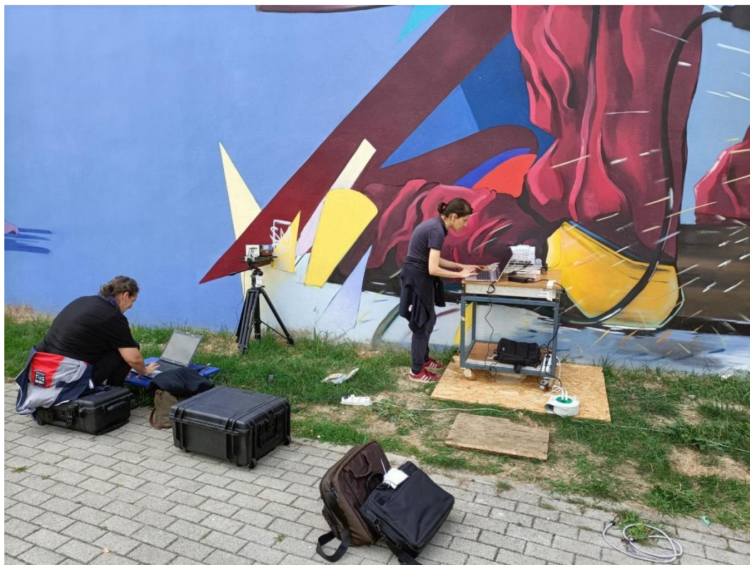
Figura 7 - Particolare del murale urbano: "Necesse" realizzato da SMOE Studio a Milano. Valutazioni dei materiali costitutivi tramite strumentazioni portatili.