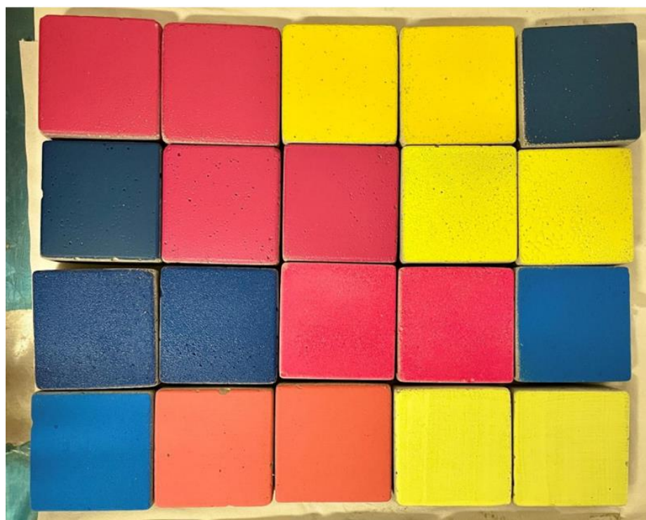
Figura 8 - Provini realizzati ad hoc per testare i protettivi selezionati nel progetto.